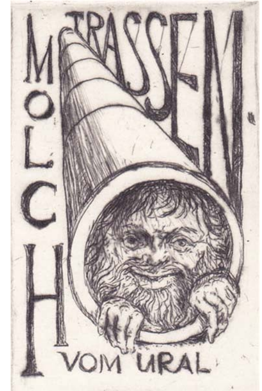
Zeichnung: Gerd Hallaschk

09.-11. Juli 2021 Jugendzentrum H.O.L.Z. 02906 Niesky Muskauer Straße 23a